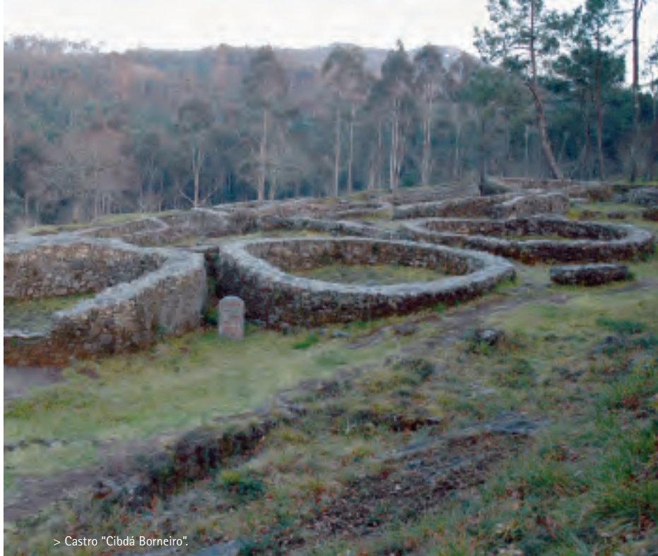
> Castro "Cibdá Borneiro".